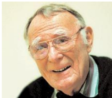
Основатель IKEA Ингвар Кампрад

Предлагаемая продукция имела четкие дифференцирующие черты. Все было простым, качественно сделанным, по-скандинавски элегантным. Все продавалось в разобранном виде для самостоятельной сборки покупателями, что снижало цену и срок доставки из магазина (чем отличаются другие мебельные фирмы). Огромные пригородные магазины имели огромные парковки, рестораны, детские игровые комнаты, инвалидные кресла и т.п. Покупатели ожидали стиля и качества по разумным ценам. IKEA реализовала эти ожидания, предоставляя покупателям возможности самостоятельного создания ценности путем исполнения функций, традиционно отдаваемых производителю или продавцу: например, доставка и сборка. Разумеется, это также снижало издержки. Также на это работало и то, что покупателям в торговом зале выдавались бумажные «метры», карандаши и блокноты для записей – требовалось меньше продавцов.